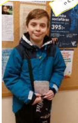
o św. Faustynie