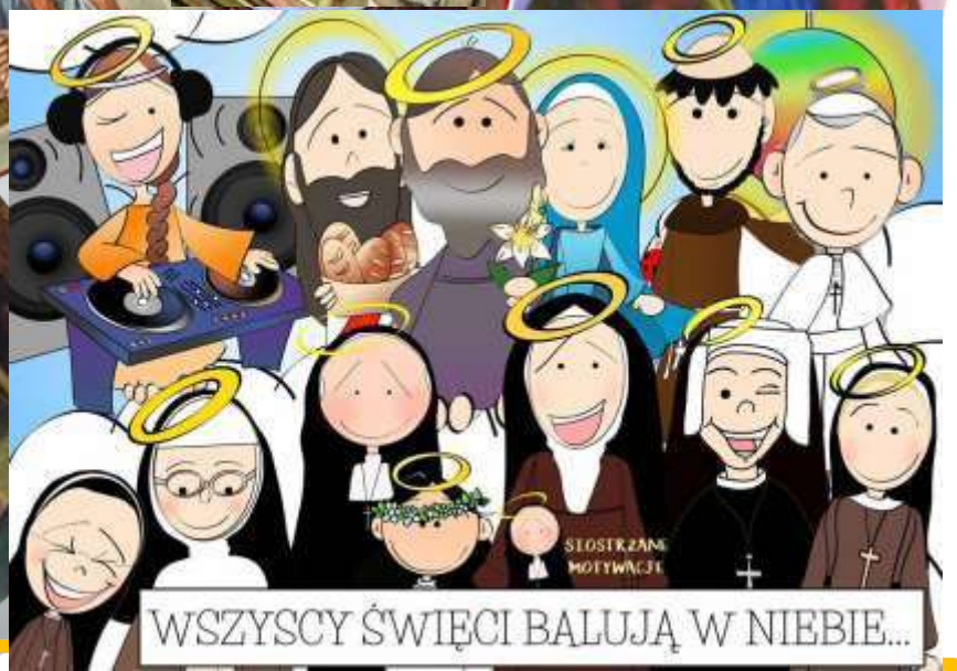
Bal Wszystkich Świętych